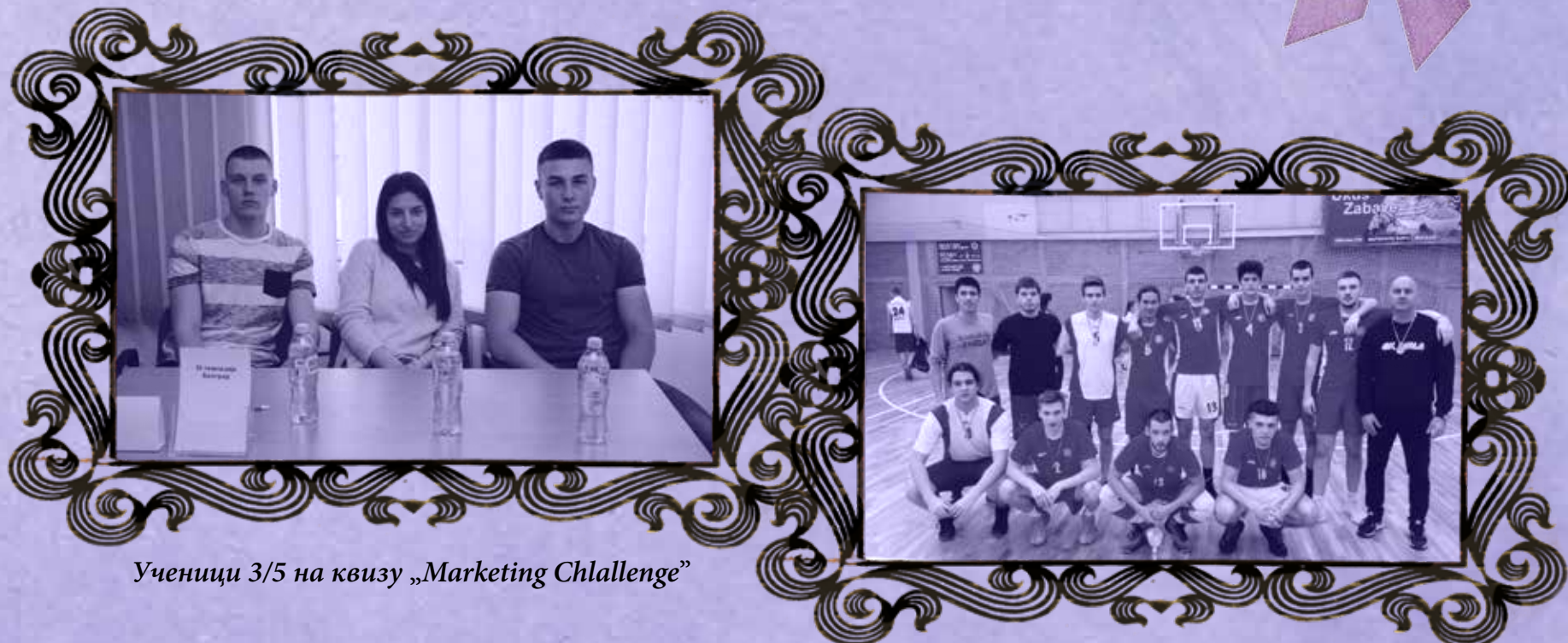
Ученици 3/5 на квизу „Marketing Challenge“