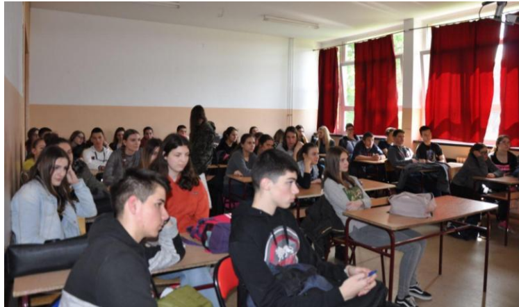
ученици IV гимназије