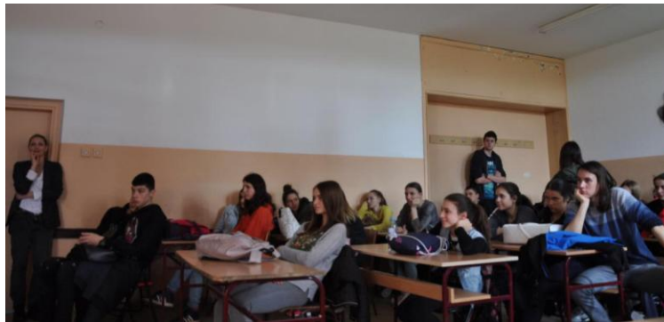
ученици IV гимназије